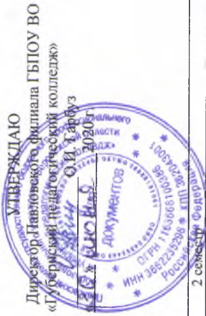
ГРАФИК УЧЕБНОГО ПРОЦЕССА Павловского филиала ГБОУ ВО «ГПК» на 2020-2021 учебный год Специальность 49.02.02 Адаптивная физическая культура