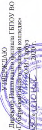
ГРАФИК УЧЕБНОГО ПРОЦЕССА Павловского филиала ГБОУ ВО «ГПК» на 2020-2021 учебный год Специальность 49.02.01 Физическая культура