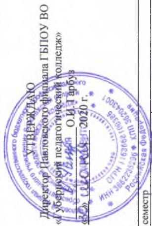
ГРАФИК УЧЕБНОГО ПРОЦЕССА Павловского филиала ГБПОУ ВО «ГПК» на 2020-2021 учебный год Специальность 44.02.02 Преподавание в начальных классах